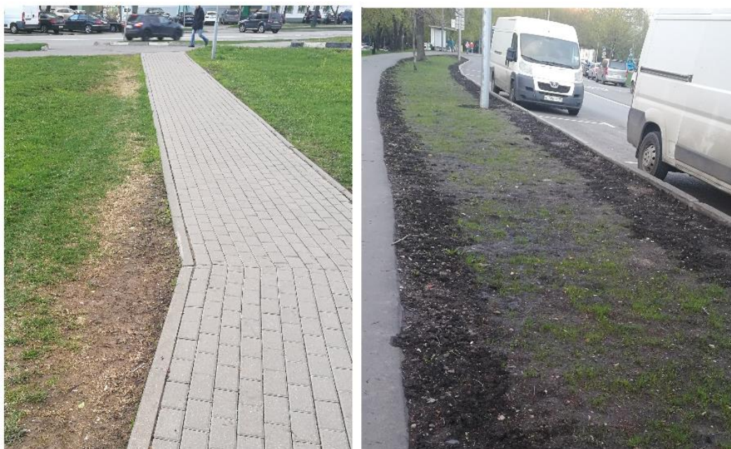
Рисунок 1. Результаты неверно выполненного тротуара

Санитарно-экологический фактор градостроительного планирования и его роль в жизни человека. В больших городах почти 90% поверхностей может быть покрыто водонепроницаемыми поверхностями, что приводит к значительным изменениям водного режима и состояния почвенного и растительного покрова. Изменения в природной среде ведут к изменениям и в техногенной среде. Прогнозирование таких изменений часто не производится, а последствия игнорируются [3]. Примером этого могут служить тротуары и дороги в удаленных от центра районах Москвы, представленные на рисунке 1.