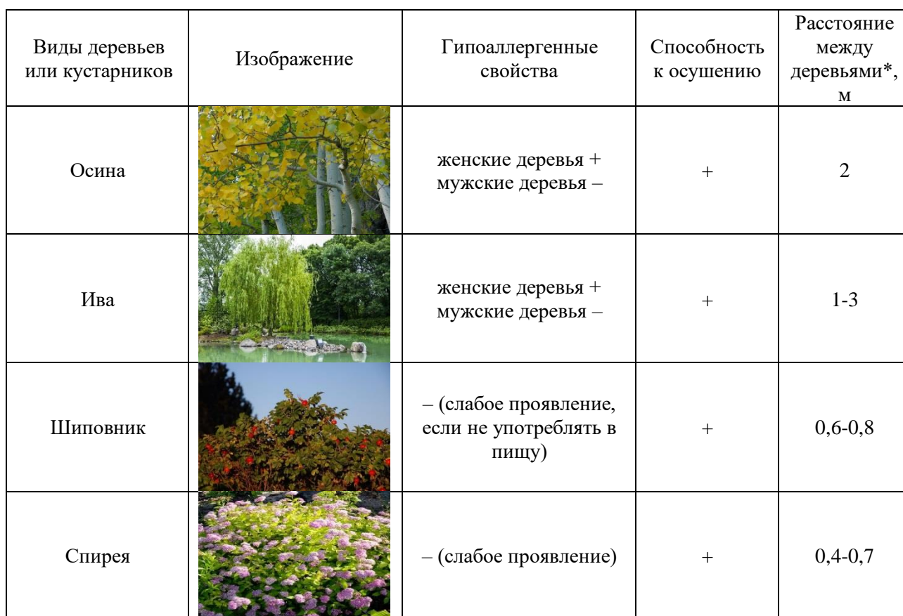
Таблица 1. Пример списка деревьев, рекомендованных к высаживанию в городской среде (составлено авторами)

Как известно, многие деревья являются естественными «осушителями» грунта. Например, в Нью-Йорке в правилах землепользования и застройки введено нормирование «уличных деревьев». Оно определяет требуемое количество деревьев для определенной площади территории, а также виды деревьев, разрешенные к высаживанию. В Москве 39% «уличных деревьев» составляют березы. Учитывая, что качество воздуха в больших городах не всегда оказывается благоприятным, а аллергия на березовую пыльцу по распространенности и тяжести протекания превосходит даже аллергию на шерсть животных, особенно остро возникает необходимость введения нормирования «уличных растений» в нашей стране [4]. Возможный рекомендуемый список «уличных деревьев», благоприятно воздействующих на окружающую среду и здоровье человека представлен в таблице 1.