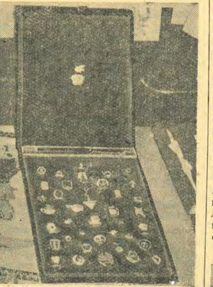
Замечательный набор подготовила группа ТГиб V-2.

Альбомы, альбомы — 45 штук одних альбомов, из них 21 — с видами Москвы, с теми самыми открытками, которые продаются