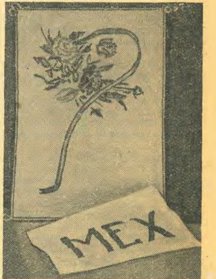
Следует поздравить механиков: эта вышивка единственный подарок всего факультета.