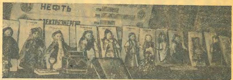
Хорошая идея была — одеть кукол в национальные костюмы.

Второе место по многочисленности на выставке занимают... куклы. Хорошая идея была у 2-й группы II курса факультета ТГиб: одеть кукол в национальные костюмы союзных республик, однако вряд ли можно, например, ска-