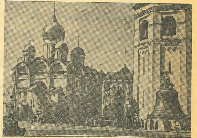
Кремль. Архангельский собор.