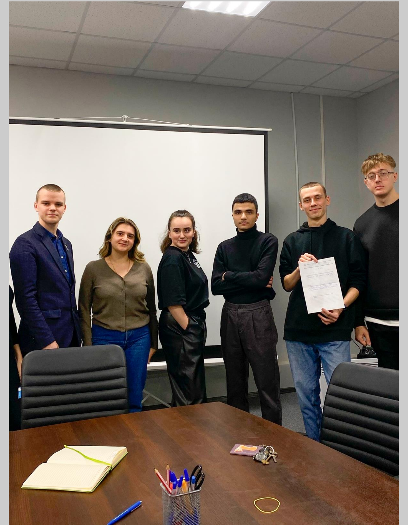
Встреча с студенческим советом общежитий МИСиС